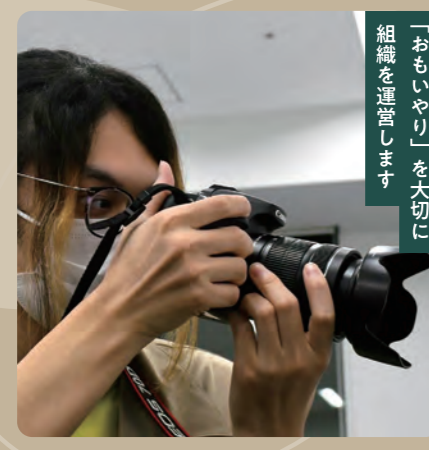
「おもいやり」を大切に 組織を運営します

①ジャーナ研会長とフリーペーパー部門長(以下、フリペ)を兼任しています。ジャーナ研会長としてはイベント等をまとめる役割を担い、フリペでは「Konasty」の発行に携わっています。紙版は休刊、電子版はKoma Shift「駒大生の本棚」内で公開。②「コロナ禍でオンライン授業が続くなか、大学と関わりたくオンラインに参加できるジャーナ研を知りました。③大きな組織では「おもいやり」が大切な潤滑油であると感じました。④会長とフリペの仕事が被った時は、ジャーナ研の会員は約50名おり、一つの社会集団としての学びがありました。私は社会学を専攻しており、将来も大学院で社会学を研究したいです。⑤入所や質問等は、駒澤大学ジャーナリズム政策研究所で検索してください。