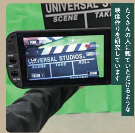
たくさんの人に観ていただけるような 映像作りを研究しています

①ユースメディア部門に所属し、映像の研究制作を行います。前期は個人と部門で制作シナクルに応募する事もあります。後期は前期の作品鑑賞や研究をします。②映画・ドラマなど動画が大好きで映像編集に興味がありました。③番組制作では多くの人の関わりがあり、たくさんの時間がかかることを知り、映像制作の流れを再認識しました。また、本格的な機材が使用でき技術の幅が広がっただけでなく、制作の中で皆の仲も深めることができました。④撮影当日の状況によって臨機応変な対応が必要になることです。⑤マスコミ関係の裏方で編集や企画などに携われる仕事を希望しています。⑥魅力的な映像コンテンツを届けたいと思います。皆さんも「好き」を活かし楽しめること見つけてみてください。