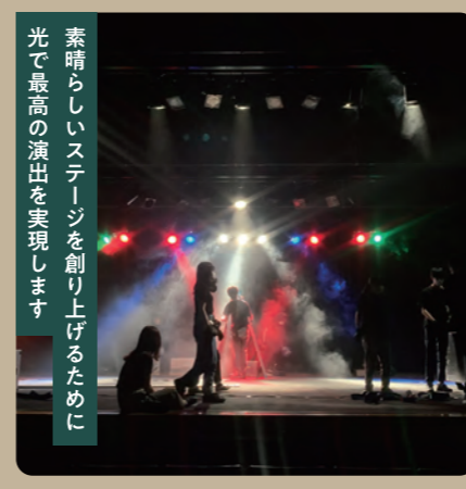
素晴らしいステージを創り上げるために 光で最高の演出を実現します

①依頼者の要望のもと、0から手作りで舞台を演出しています。②高校時代に見た発表会で照明の持つ力に圧巻されました。創作活動が好きで演出で感動を届けたく、直感で入部しました。③礼儀や責任感、発想力、協調性など多くの自己成長があります。④時間の使い方は、光の演出では多くの事を決めます。決断力を高め、広く思考する時間を作ることが目標です。今後は部全体での技術の上達にも注力します。⑤舞台演出や照明等を視野に入れていますが、仕事以外でも光や芸術関係の創作活動は続けていきます。⑥「直感」を信じ、入部したことで人生の視野が広がりました。皆さまも心ままに行動してみたいかがでしょうか。