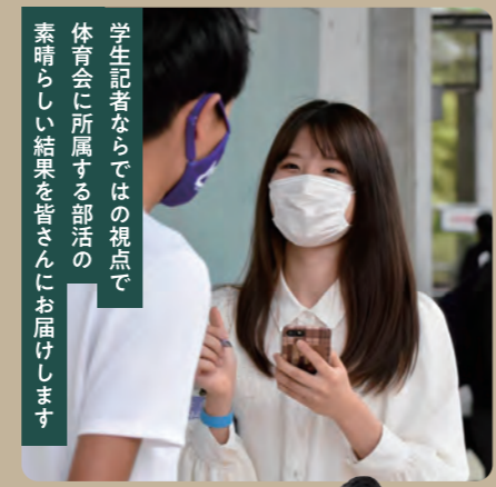
学生記者ならではの視点で 体育会に所属する部活の 素晴らしい結果を皆さんにお届けします

①体育会系部活の取材とSNSでの発信、年4回の駒大スポーツ新聞の発行です。②文章が好きで高校の先生の勧めもあり、調べたいところ、コマスポを発見しました。スポーツ好きで箱根駅伝は以前より観戦しており、素晴らしい結果を残す部活の情報を発信したいと思いました。③文章力や語彙力、マナーを学べます。④授業と取材の折合いやコロナ禍で取材が満足に行えないことです。⑤三大駅伝を取材したいです。将来はスポーツに関わる仕事に憧れています。⑥コマスポは沢山の手助けと読者の方で成り立っており、御礼申し上げます。今後も学生記者だからこそ引き出せる選手のありのままの言葉や企画で部活の情報を発信していきます！