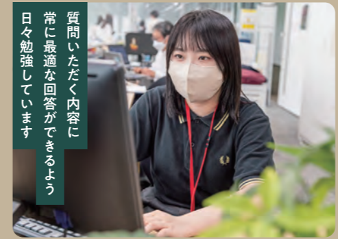
質問いただく内容に 常に最適な回答ができるよう 日々勉強しています

①総合情報センター窓口でのサポートや、1・3号館での受付業務を行っています。また、卒業式や入学式のライブ配信、オンラインセッションの支援、夏・冬にはPC教場の大掃除なども行っています。②アルバイト募集のポスターを見て応募しました。③質問に対してどのように問題を解決するか、答えを探る力が身に付きました。④窓口に来る学生の質問はほとんどがPC関連なのですが、私はもともと詳しくない方だったので不慣れなスタッフの方に聞き勉強しながら対応しています。⑤英語を使った仕事でしたいのでPCで分からないことがあったら是非来てみてください！